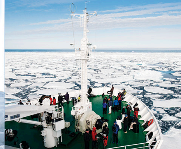
以上圖片由船公司提供，只供參考